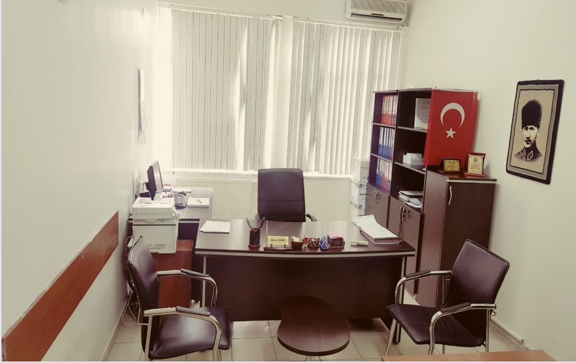
Lisansüstü Eğitim Enstitüsü

Kayseri Üniversitesi olarak Erciyes Üniversitesinden ayrılan ve yeni kurulan birimlerle birlikte Enstitümüz, 18.05.2018 tarihli ve 30425 sayılı Resmi Gazetede yayınlanan 7141 sayılı “Yükseköğretim Kanunu ile Bazı Kanun ve Kanun Hükmünde Kararnamelerde” deęişiklik yapılmasına dair kanunla birlikte kurulmuştur. Enstitü Müdürü, Müdür Yardımcısı ve Anabilim Dalı Başkanlıklarının çoęunluęu Uygulamalı Bilimler Fakültesi binasındadır. Sadece Elektrik-Elektronik Mühendislięi Anabilim Dalı Başkanlıęı Meslek Yüksek Okulu binasında olup, “Enstitü Öğrenci İşleri”, “Merkez Öğrenci İşleri” içesindedir. Yazı İşleri Birimi ise Uygulamalı Bilimler Fakültesi binasında zemin katta 38 numaralı odada faaliyet göstermektedir.