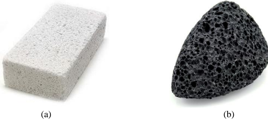
Tablo 1.1. Örnek görsel nesne (varsa atıf sistemine göre atıf eklenir.)